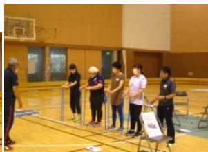
*キャッチングザスティック