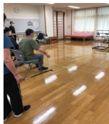
*若林障害者福祉センター (ラダーゲッター)