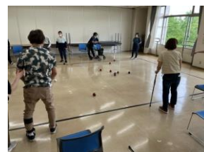
*泉障害者福祉センター (ボッチャ)