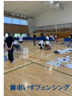
■車いすフェンシング