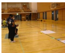
*ボール de カーリング

テーマは「ニュースポーツ体験会」。参加者20人が5つのニュースポーツ(キャッチングザスティック、ボール de カーリング、ラダーゲッター、スカットボール、卓球パレー)を体験し、講師として指導活動を行う場合を想定した学習も行われました。