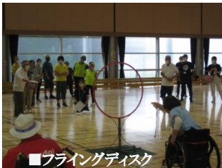
■フライングディスク

今年も各区5つのチームに分かれて「フライングディスク、紙ちぎり紙のぼし、投げチャ、ゲートボール百発百中、玉入れ」の競技で優勝を争う運動会。さらに、全員参加のパン掴み競争もあり、皆さん楽しまれました。