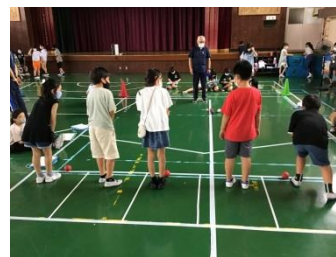
*7月12日金剛沢小学校