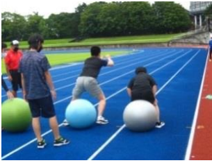
*9月4日陸上競技(トラック競技)