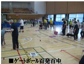
■ゲートボール百発百中