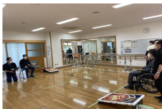
*若林障害者福祉センター (バックコー)

今期6回、障害者福祉センター(自立訓練事業)利用の皆さんに指導活動を行い、スポーツの楽しさを体験して頂いています。