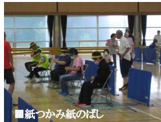
■紙つかみ紙のぼし