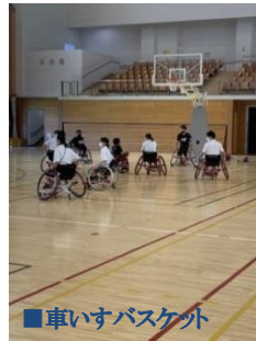
■車いすバスケット

「競技スポーツに挑戦したい、他の競技にも挑戦してみたい、もっと上達したい」というそんな皆さんを応援するイベントです。初日には、体験前の体力測定として各コーナーが用意されていました。