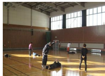
*ビジョントレーニング