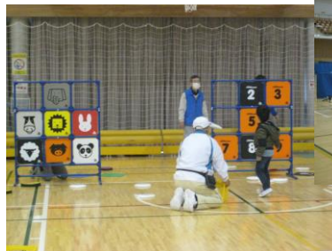
*ディスクゲッター