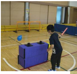
■視覚障害疑似体験

110 名以上の方が来場されました。今回、視覚障害疑似体験コーナーを設けて歩行/風船割り/ゴールボールをアイマスク装着で体験してもらいました。また、車いす体験コーナーや各スポーツコーナー(フライングディスク、卓球バレー、風船バレー、ボッチャ、バドミントンなど)で皆さん、思い思いに体験し、楽しんで頂きました。