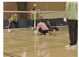
*フロアバレーボール

◇広報誌は仙台市障害者スポーツ協会 HP( https://www.sendai-dsa.jp/ )の「指導者協議会」のページで公開しております。