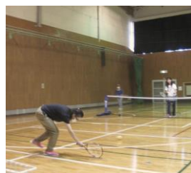
*ブラインドテニス

視覚障害者でもできるスポーツ体験会でした。種目としてブラインドテニス、フロアバレーボール、サウンドテーブルテニス(STT)が用意されていました。ブラインドテニスを体験しましたが、空中のボールを打つということだけでも至難の業と実感。