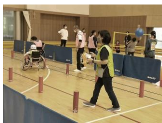
*競技用車いす乗車体験