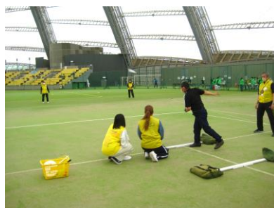
* ディスタンス競技