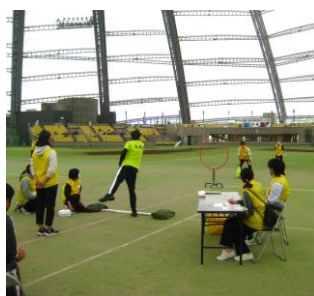
* アキュラシー競技